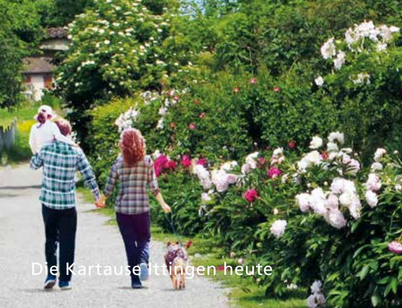
Die Kartause Ittingen heute