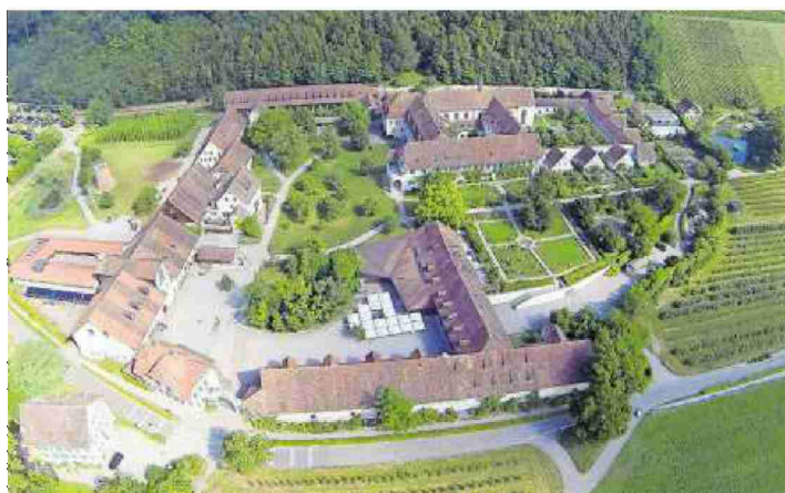
7130 Quadratmeter Dachfläche in der Vogelperspektive.

Natürlich nimmt die Kartause Ittingen auch Geld ein. Das meiste kommt vom Seminarhotel und dem Restaurant; der Sozialbetrieb ist selbsttragend. Die Landwirtschaft und die Pflanzenveredelung werfen keinen Gewinn ab und sind in erster Linie ein Aushängeschild der Kartause Ittingen wie die Gärtnerei mit all den Blumen und Kräutern. Die beiden Museen, das Kunst- und das Ittinger Museum, betreibt der Kanton.