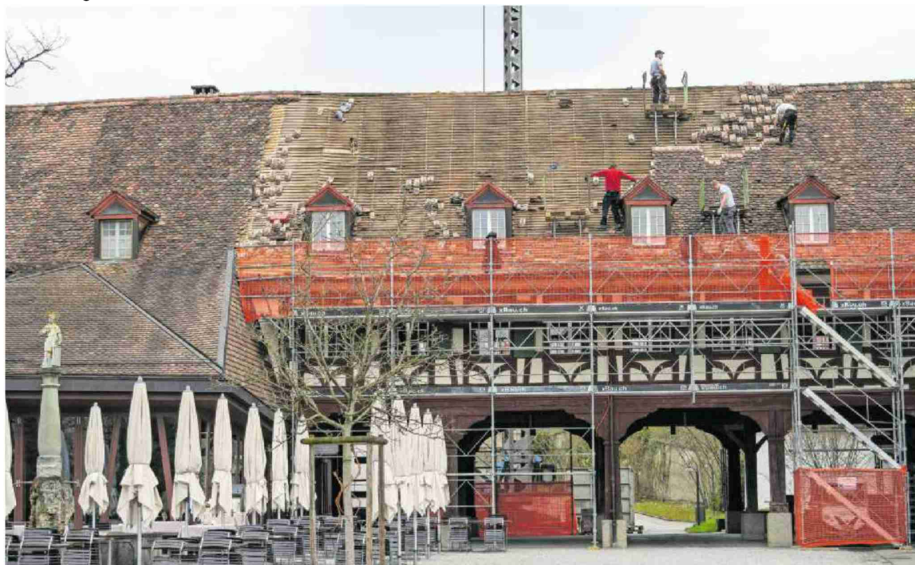
Kartause Ittingen: Eines der Dächer wird abgedeckt und dann auf Schädlingsbefall und Defekte geprüft.